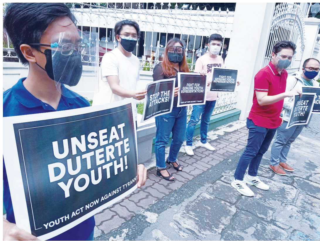
一個反專制政權的青年組織昨日前往大理院提交請願，要求組織杜特地青年黨的一名候選人就任眾議員。選舉署較早為杜特地青年黨的候選人進行宣誓。