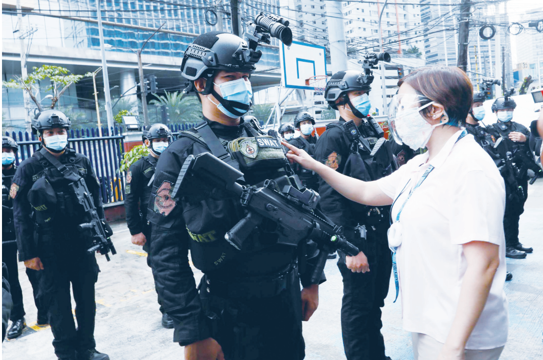
馬加智市長敏乃昨日檢查該市特警部隊的設備。馬加智市政府收到相關人士捐贈價值9100萬披索的武器、移動設備和保護裝置等，作為該市警隊現代化項目的一部分。

根據移民局的紀錄，自2017年起，約400萬中國人入境菲國。落地簽政策已在今年一月起，因新冠肺炎疫情而被暫停。