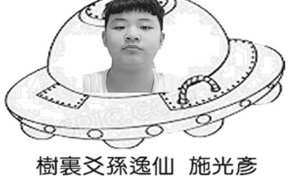
樹裏交孫逸仙 施光彥

夢想是人們想要的未來。它可以是他們想要的職業或想要的生活。這就是你的激情所在。這就像燒木頭，讓一個人盡其所能。任何人都可以夢想，但挑戰在於實現它，因為你會在生活中遇到許多能勸阻你的事情。跟其他人一樣，我對未來也有一個夢想。我們認為做一個夢是很容易的事，但要實現它需要多大的耐心與努力。許多人在實現既定目標時，遭遇困難而最終放棄，但我是一致的、有耐心的。我願意參與到實現我的目標和夢想的努力中。我現在是那個夢想的第一步。從小我的夢想就是成為一名企業主或一名醫生，但誰知道未來會發生什麼？我可能也想像成為一名宇航員或科學家，但我的終極夢想是能夠幫助人們。我的目的是要對我的生活感到快樂和滿足。我們從來沒想到某個人會到天空上。在中國的傳統習俗中，祖先想知道神秘的天空，做了各種各樣的傳說。直到技術發展後，才實現中國古老的科學家的夢想，登陸到了個行星。 我儘量想要學多其他行星的知識，想周遊世界，遇到好多從深洋過海的新朋友並做出社會的成就。未來是不受我的控制，但對我來說，無論明天會怎樣，我都要面對障礙和困難，要繼續展望未來。因為一切都始於夢想，所以只由你來做任何事情並實現你的夢想，就像那句名言“星星觸手可及”。