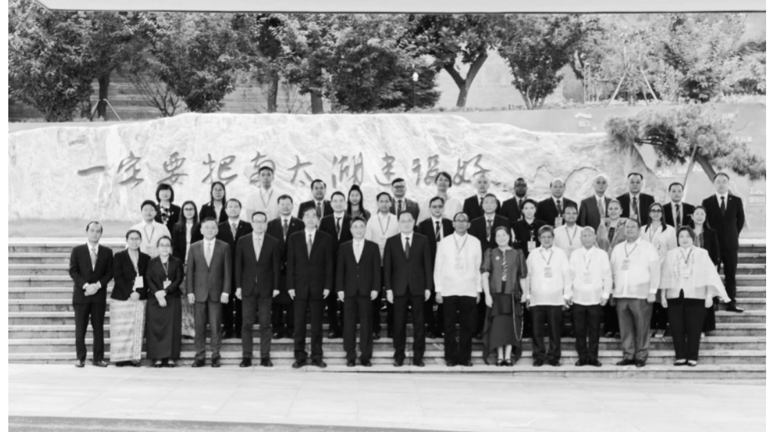
5月22日—27日，加牙鄺省省長萬雷·曼巴率領加牙鄺省代表團訪問中國。