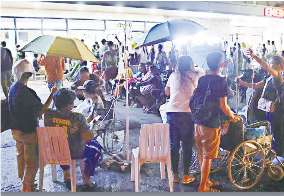
武端市7.4級地震後疏散醫院患者

他說：「對於那些在這場毫無意義的暴力和恐怖主義行為中喪生的人的家屬，請接受我們最深切的哀悼和同情。我們將確保正義得到伸張。」