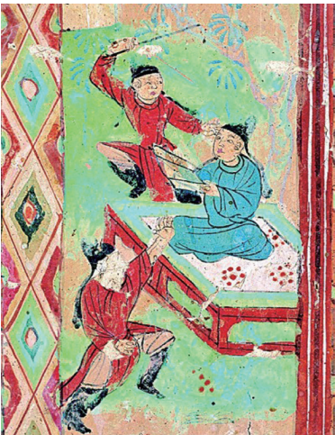
▲盛唐劍術圖壁畫。 ►五代射箭圖壁畫。