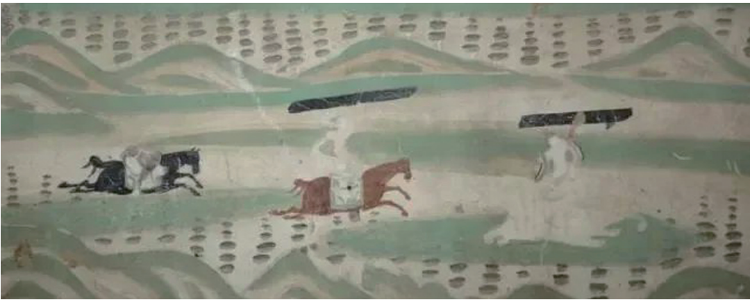
▲騎馬舉鐵板圖壁畫。