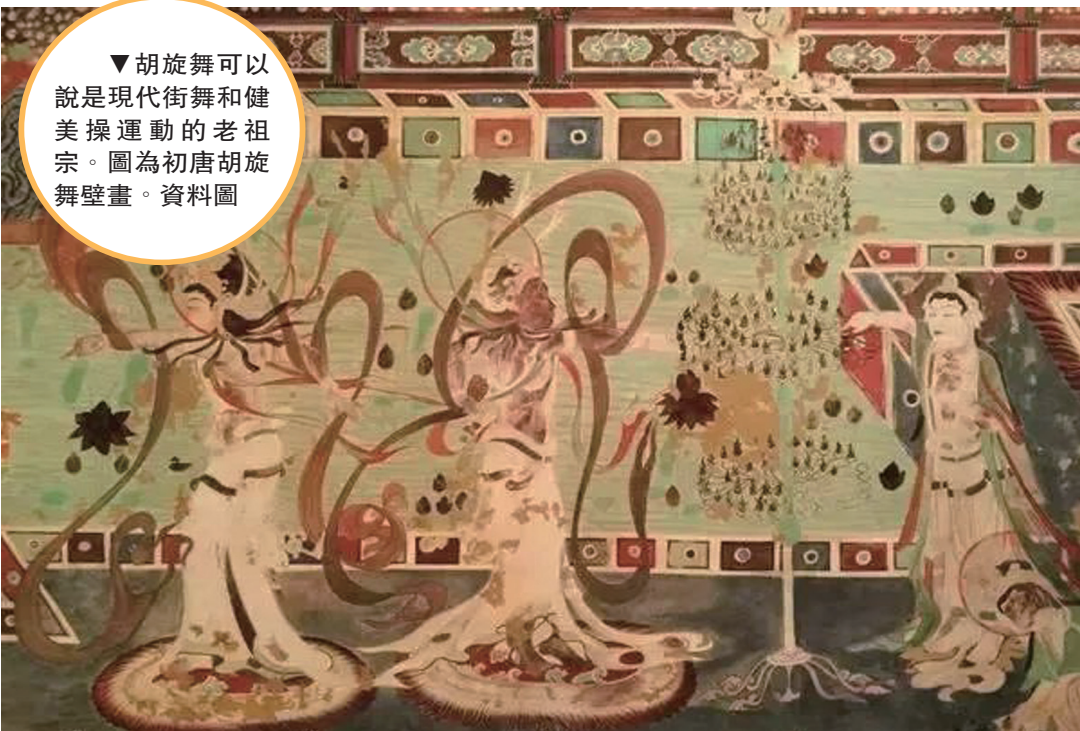
▼胡旋舞可以說是現代街舞和健美操運動的老祖宗。圖為初唐胡旋舞壁畫。資料圖

武術類項目在敦煌壁畫中也有著不同形式、不同招式的描繪。莫高窟北魏時期的 251 窟中就描繪有兩位金剛力士搏擊的場面，他們均赤裸上身，下著犢鼻褌，左邊力士呈僕步步型，右邊力士似側弓步劈掌，雙方動作剛猛、發力飽滿，呈現出典型的當代外家拳風格。在莫高窟 61 窟的五代屏風畫中，還有一幅展現多人在叢林空地上集體練拳的屏風畫。圖中練拳者既有拳法，又有腿法，同時始終保持立身中正。整個畫面連起來恰似一個個武術套路的分解動作，類似當代內家拳典型技法。上述兩幅武術壁畫，將中國傳統武術不同時代發展特點和傳承性表現得淋漓盡致。