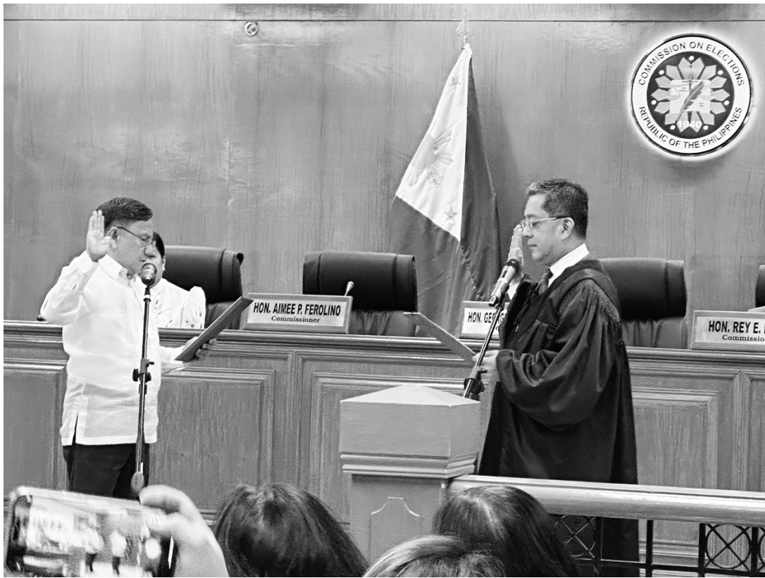
新任選舉署專員比波昨日在選舉署長加西亞前面宣誓就任。