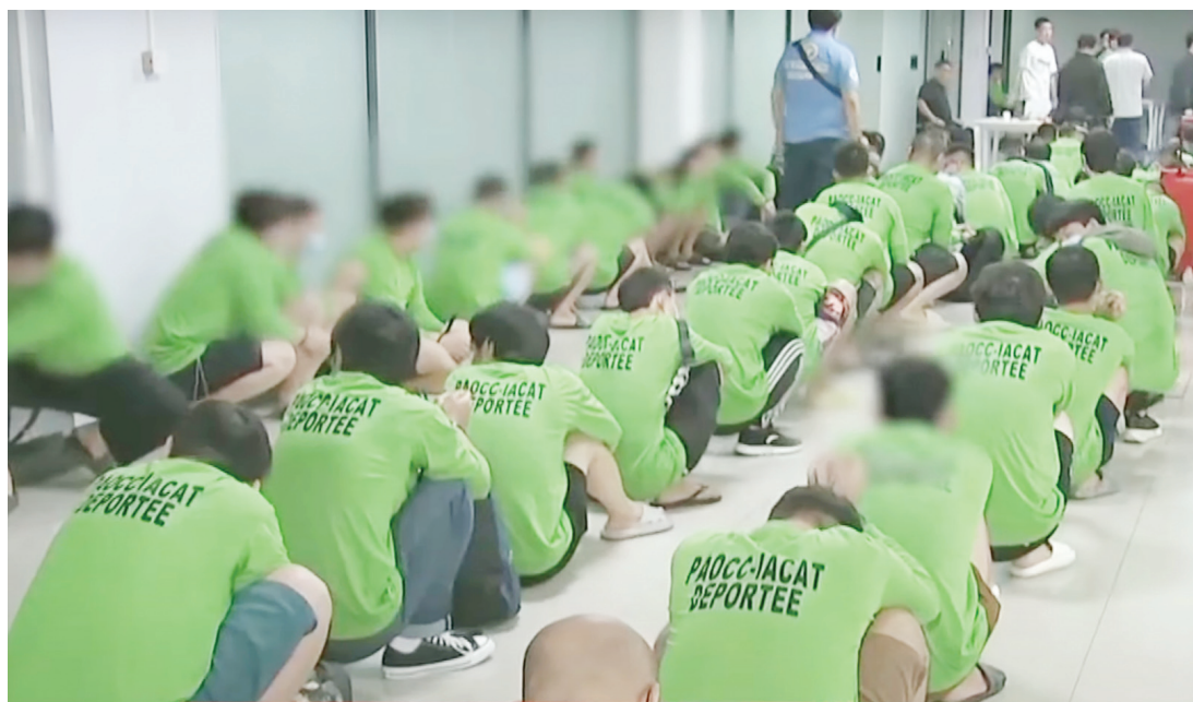
89名涉嫌參與非離岸博彩運營商及詐騙中心的韓國和越南人被驅逐出境。

「每驅逐一名涉及非法運營的外籍人士，菲律賓民眾就少一分威脅。」他補充道，「驅逐僅是行動的一環，我們將建立區域性情報共享、協同合作及法律聯防機制，確保犯罪集團無法從菲律賓轉移至其他司法管轄區後死灰復燃。」