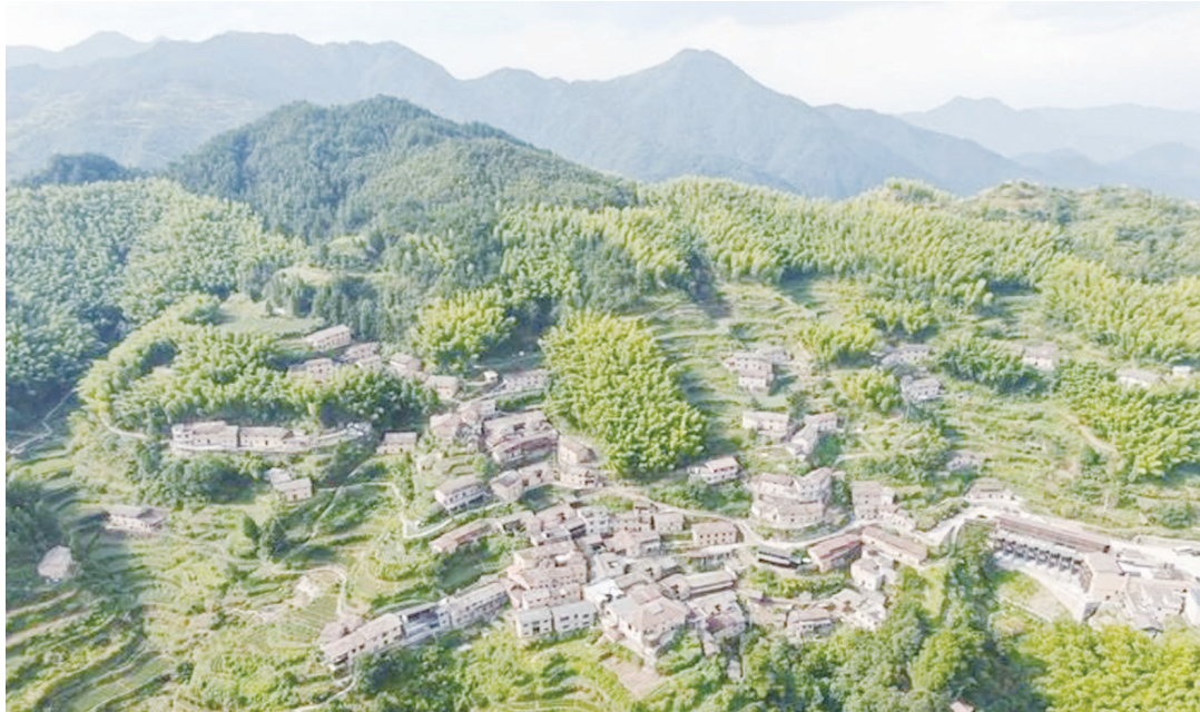
▲航拍松陽縣四都鄉陳家鋪村。

旅遊、康養、休閒、民宿……在大山裡「遍地開花」，人們稱麗水為心之嚮往的隱居之地。