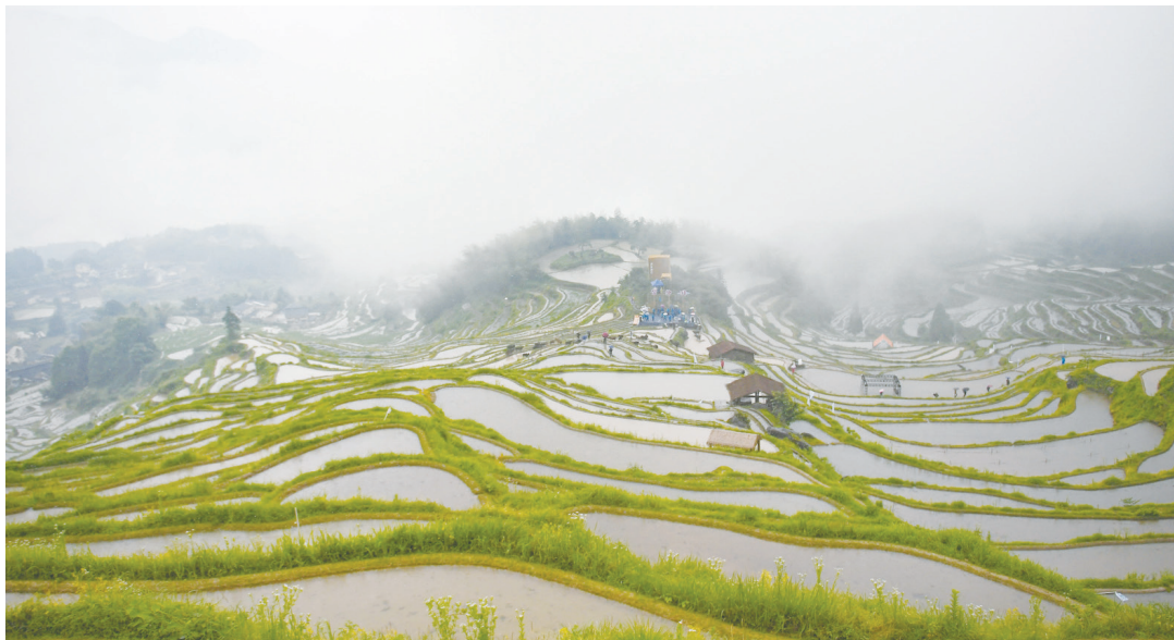
▲芒種時節，麗水雲和梯田舉行開犁節，再現明代開墾場景。

麗水下轄 9 個縣（市、區）：蓮都、龍泉、青田、雲和、慶元、縉雲、遂昌、松陽、景寧。這些地名聽起來就彷彿人間仙境，怪不得麗水美景讓人如癡如醉。