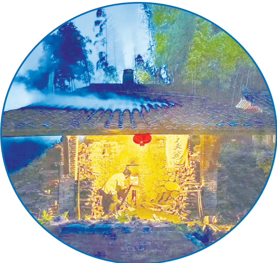
▲龍窯燒製龍泉青瓷。