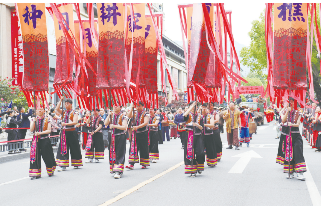
▲麗水市景寧畲族文化沉浸式展演。

2005 年，遂昌金礦獲批首批中國國家礦山公園，通過生態修復、優化開採模式，把保存完好的礦業開發遺跡和礦業文化資源、廢棄的礦洞、廠房進行綜合利用，與礦區自然環境相融合，建設成景區，極大地促進了礦區環境保護和生態恢復。