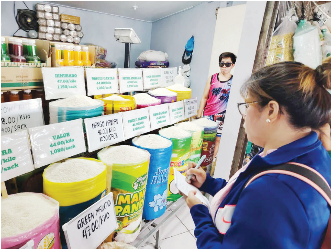
社會福利部國首區辦公室透過「社會福利部無飢餓計劃」，在馬尼拉與計順市各市場進行價格監測。該監測旨在根據建議零售價為社會福利部認證零售商提供價格指引，確保計劃受益者能獲得價格合理的食品。