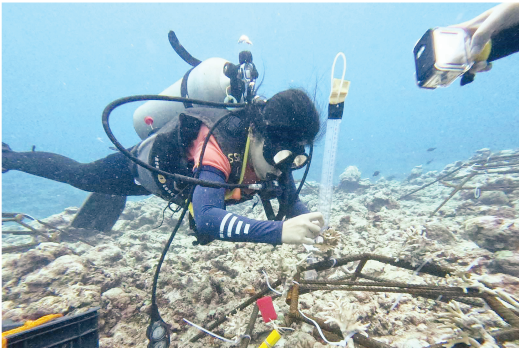
菲海岸警衛隊週三宣佈，在巴拉灣省自由群島成功完成新一輪珊瑚礁修復工作。菲海岸警衛隊在聲明中指出，此次由其海洋科學小組執行的任務，是遵循總統小馬科斯保護與恢復西菲律賓海脆弱海洋生態系統的指示。