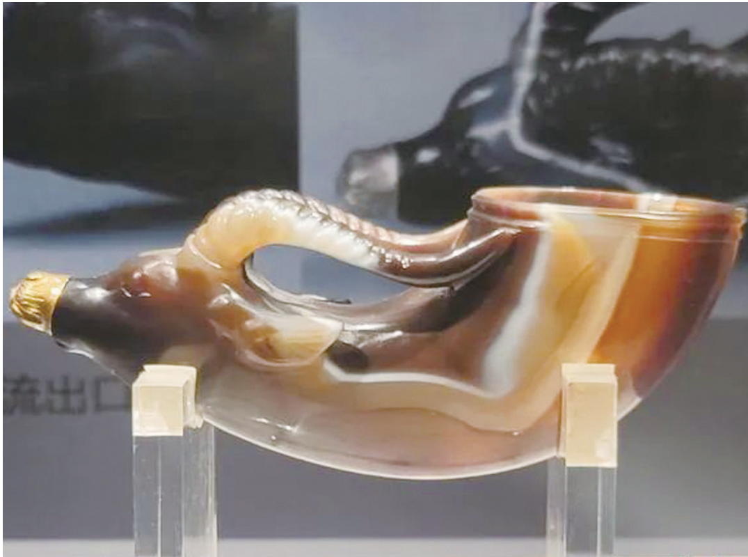
▲陝歷博館藏珍品「鑲金獸首瑪瑙盃」。

本版圖文均據中新社微信公眾號，原文標題為《人這一輩子，一定要體驗西安的「十二時辰」！》