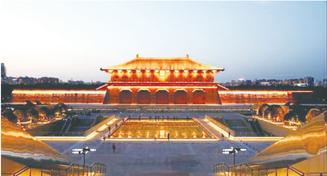
▲大明宮國家遺址公園丹鳳門。