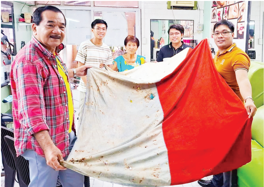
埃德伯特·傑·馬森多·卡布里溜斯教授於6月23日在臉書貼文中分享據信為首面在呂宋島以外地區飄揚的菲律賓國旗照片。卡布里溜斯教授表示，他們正進行歷史調查，透過各種合法文件與參考資料驗證這面被發現旗幟的真實性。

案》，該法案旨在修訂《家庭法典》，將民事結合定義為同性伴侶的法律關係。 並賦予財產、繼承、收養和社會保障等權利。 莎拉說：「我邀請學者們研究《民事結合法案》的社會和經濟影響，我們不僅要接納，更要實現真正量身定制的包容。」 此外，副總統呼籲加強《安全空間法》（第11313號共和國法令）的實施，強調需要更好地解決基於性別的騷擾問題，特別是在數碼時代。 <下轉第2版>