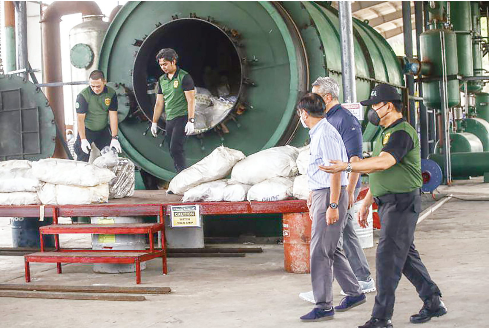
6月25日，總統小馬科斯在丹韋省加巴斯基Cutcut社區的Clean Leaf International Corp.廢棄物處理公司，見證銷毀1,530.647公斤、價值94億披索的違禁物質。