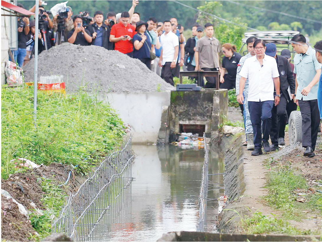
總統小馬科斯週三表示，其對武六干省的「幽靈防洪工程」感到「極度憤怒」。