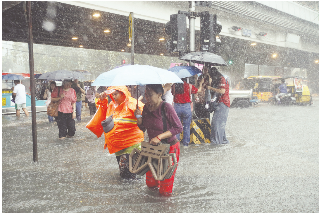
8月22日馬尼拉薩美峇區，行人正艱難涉過塔虎大道與聯合國大街交叉口近膝蓋深的洪水。位於歐羅拉省以東的低氣壓區已增強為熱帶低氣壓「怡桑」。