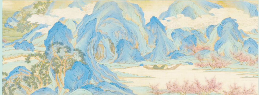
▲清·蕭晨桃源圖卷（局部）。

明清：此時青綠山水長卷繼承了宋代江山圖山勢奔騰起伏之態勢，在筆墨技法和形式風格上更為豐富。此外，清康熙乾隆時期的宮廷畫家，在青綠山水詩意、仿古、實景等主題上均有發展。