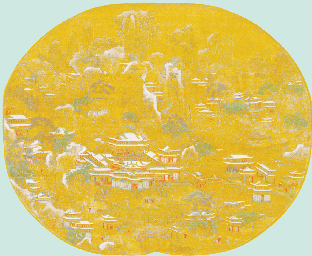
▲南宋·京畿瑞雪圖頁。

宋代：青綠山水畫的發展臻至完備。北宋後期王詵、趙令穰的青綠山水中，融入了貴族士人的趣味；王希孟《千里江山圖》和傳為趙伯駒的《江山秋色圖》，代表了宋代院體青綠山水畫的成就；趙伯駒《萬松金闕圖》在傳統青綠畫法的基礎上，融入水墨技法，體現了青綠山水畫和士人趣味的初步融合。