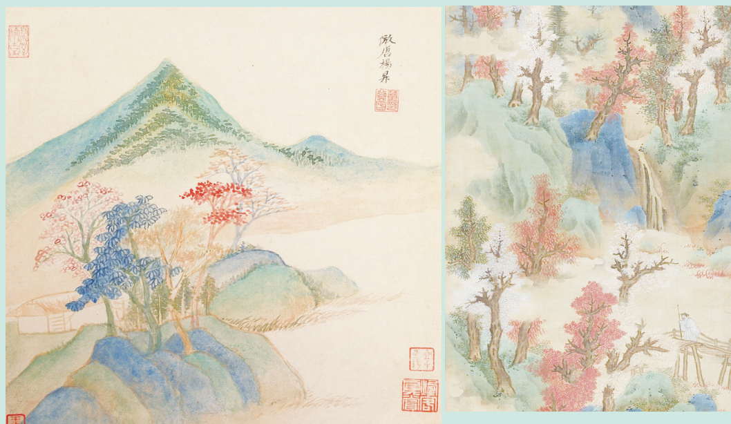
▲明·董其昌仿古山水圖冊（其一）。

晚明時期：仿古成為此時山水畫的重要內容。一眾畫家在技法上將色與墨結合，開拓了青綠山水畫演進的新格局。