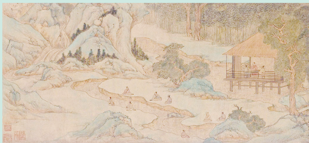
▲明·文徵明蘭亭修禊圖卷。

明代中期：與文人生活題材的結合，豐富了青綠山水的表現內容和審美意涵。此外，與院體山水風格相融合，並在其中體現溫潤文雅的文人趣味，也拓展了青綠山水的風格。