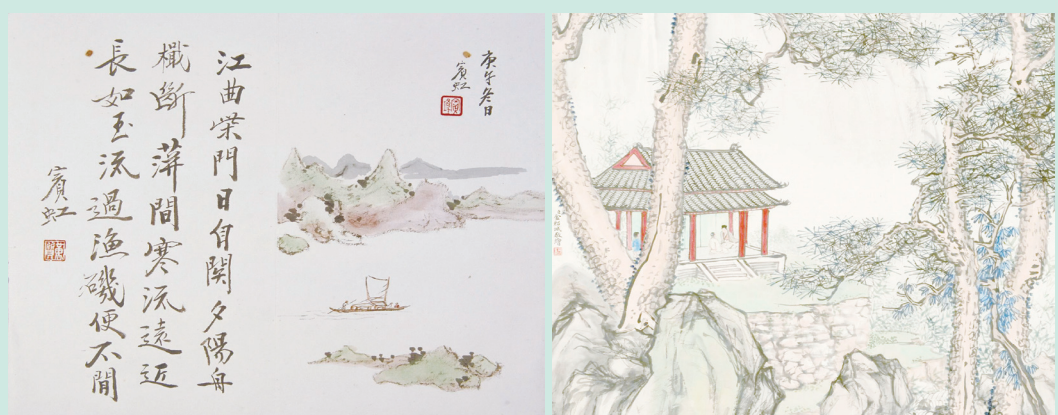
▲近現代·黃賓虹山水書畫合冊（其一）。

近現代：青綠山水畫家或更注重師法傳統，或更注重變革出新，引領了傳統青綠山水畫的轉型和新生。