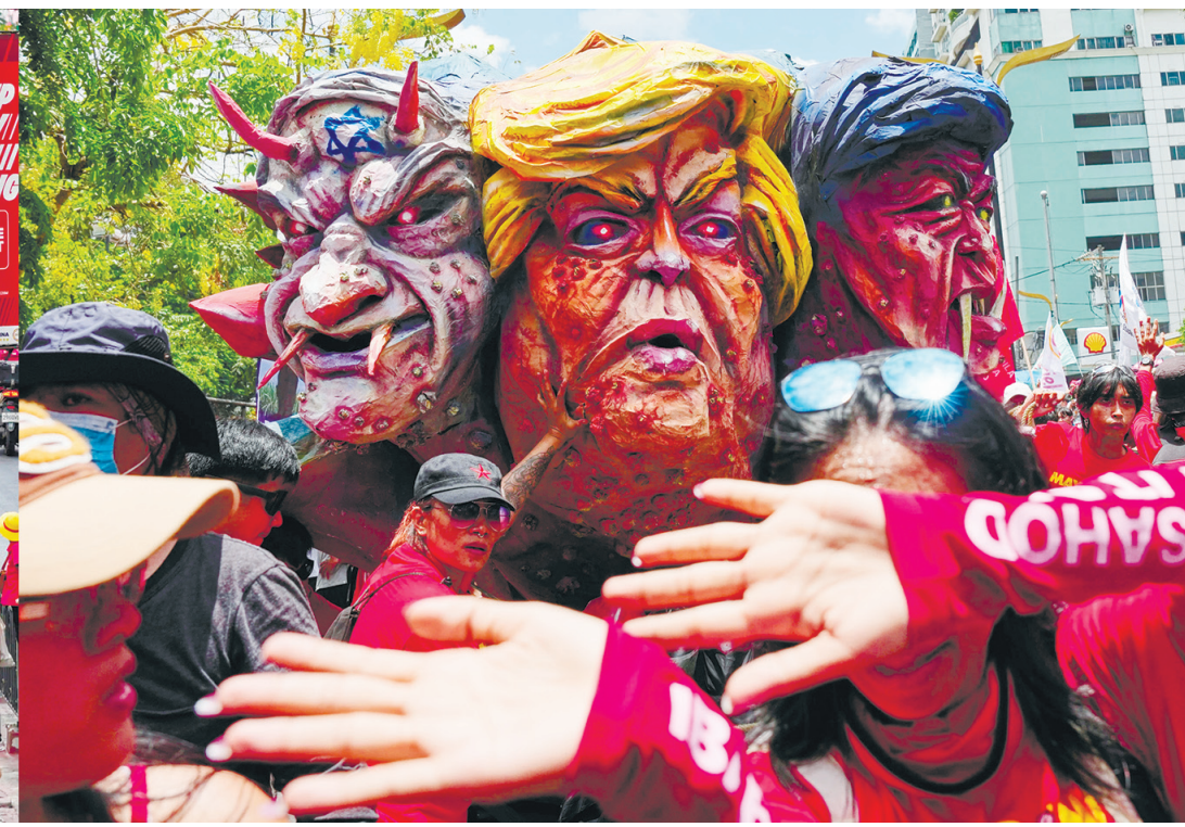
左圖為5月1日，抗議者在馬尼拉舉行的五一勞動節集會上遊行前往馬拉干鄺宮總統府。右圖為抗議者在馬尼拉舉行的五一勞動節集會上推動(從左起)以色列總理班傑明·內塔尼亞胡、美國總統特朗普和菲律賓總統小馬科斯的人偶。