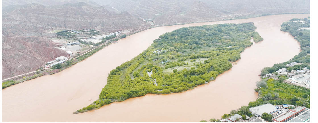
▼航拍黃河蘭州段沿岸的丹霞地貌。