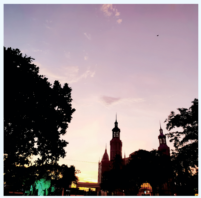
攝影——林隙間的聖殿 羅申那同和中學 林際濤