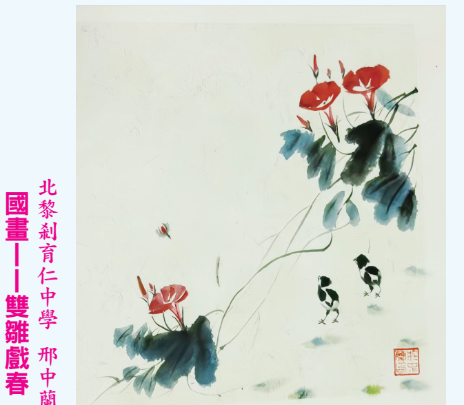
北黎刺育仁中學 邢中蘭 國畫——雙雛戲春