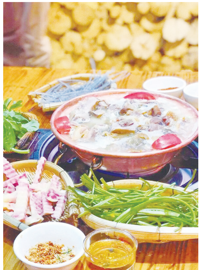
▲從左到右依次為：麗江古城中的納西族女子；身著民族服飾的遊客在麗江古城遊玩；臘排骨火鍋。