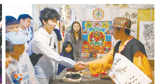
▲左圖為遊客學習東巴文；右圖為遊客體驗東巴文化。