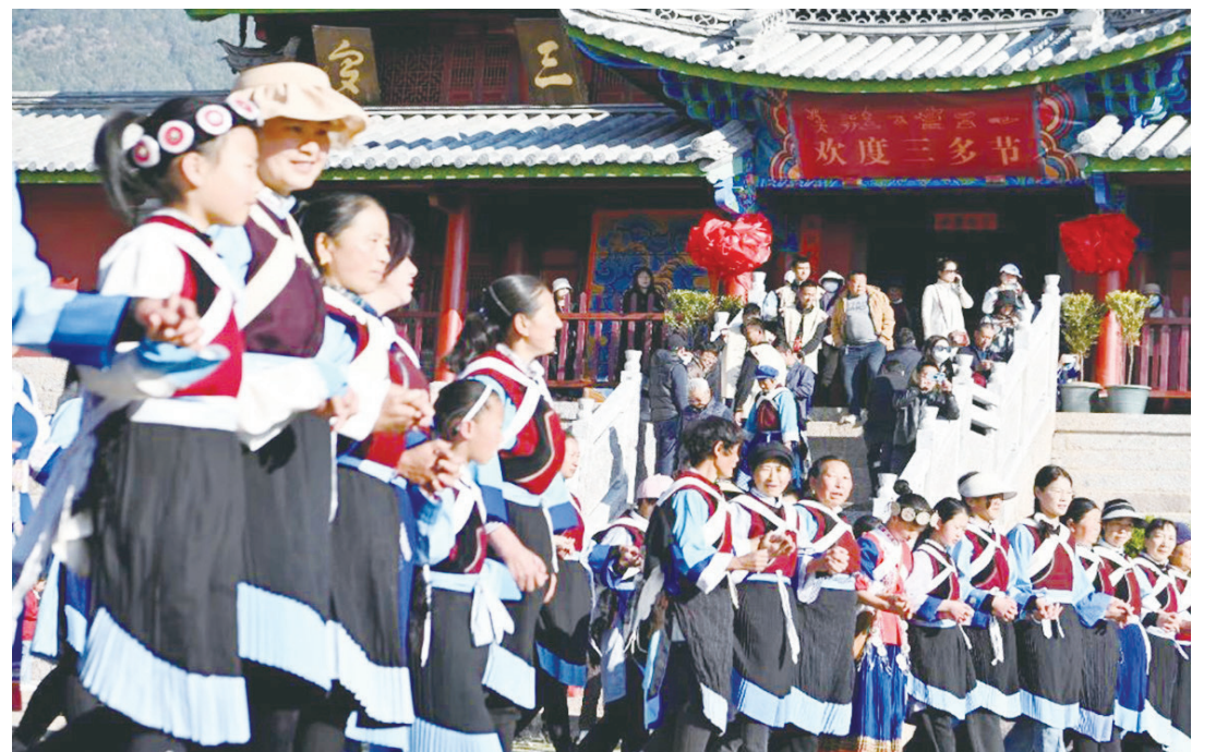
▲麗江「三多節」慶祝現場。

巷子口、石橋邊、水車旁，打起鼓、彈著琴、唱首歌，100多家民謠酒吧給這座小城帶來了治癒力量，膾炙人口的民謠把麗江的時光變得更加柔軟多情。