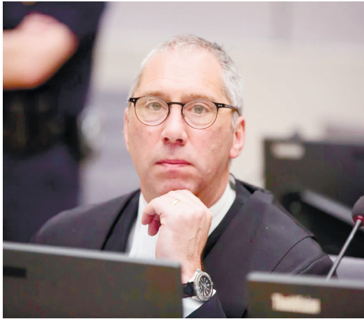
據國際刑事法院聯盟稱，本巴上訴案推翻了當時國際刑事法院歷史上唯一一項將強姦