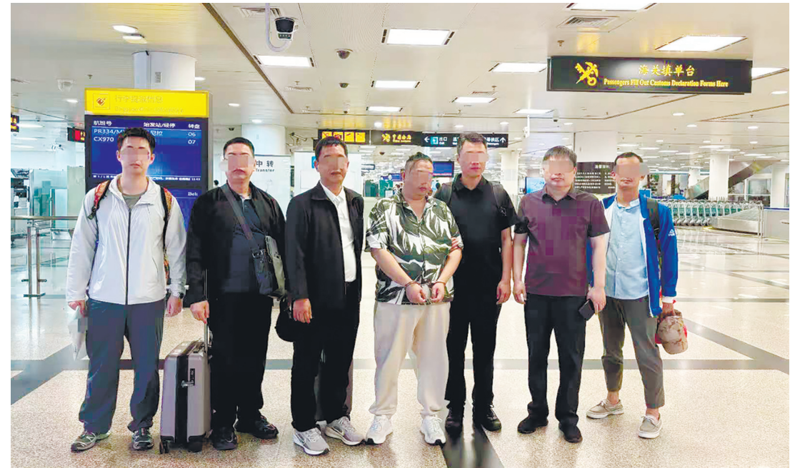
中菲兩國執法部門近日合作抓獲並遣返一名涉嫌組織跨境賭博的中國籍犯罪嫌疑人。

阿普拉斯卡早前承認，他先對位於參議院旁邊公務員保險署大樓內的國調局探員鳴槍示警。