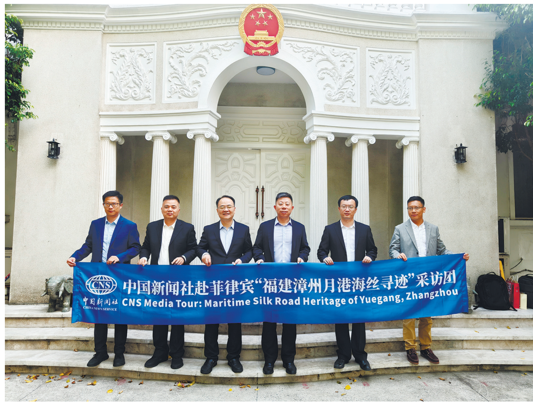
5月26日下午，中新社採訪團專程前往中國駐菲律賓演武大馬路領事館，拜會井泉大使，認真聽取井泉大使關於在菲律賓開展國際傳播工作的意見和建議並就相關話題進行了深入交流。

隨後，採訪團還前往菲律賓漳州總商會，採訪中菲「兩國雙園」項目建設進展，以及「海外漳州人」在菲律賓拼搏創業的故事，感受中菲經貿與人文交流的活力。