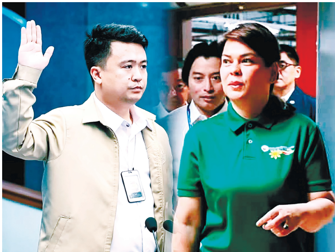
左為國調局資深探員約翰·馬克·卡利隆充當彈劾庭控方證人時宣誓。右為副總統莎拉·杜特地於週二抵達參議院，為其彈劾審判的續行程序做準備。然而，她的發言人表示，她將與她的律師會面，而非出席彈劾法庭。

本報訊：副總統莎拉·杜特地週二請求大法院制止由參議院作為彈劾法院正在進行的其彈劾案審判。