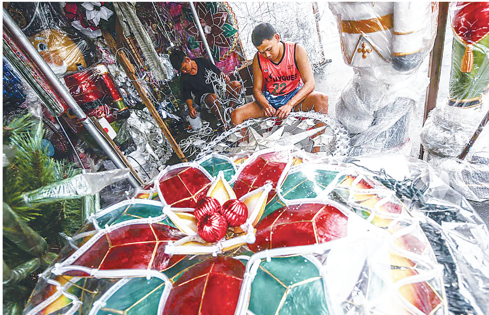
圖為一名工人昨日在計順市龜卯區農夫市場組裝巨型聖誕燈籠。該市場售賣聖誕裝飾品和各種美食，將經營到12月31日。

本報訊：智庫Stratbase ADR研究所週一表示，七成菲律賓人在2025年中期選舉中不會支持與中國有明顯聯繫的政治候選人。