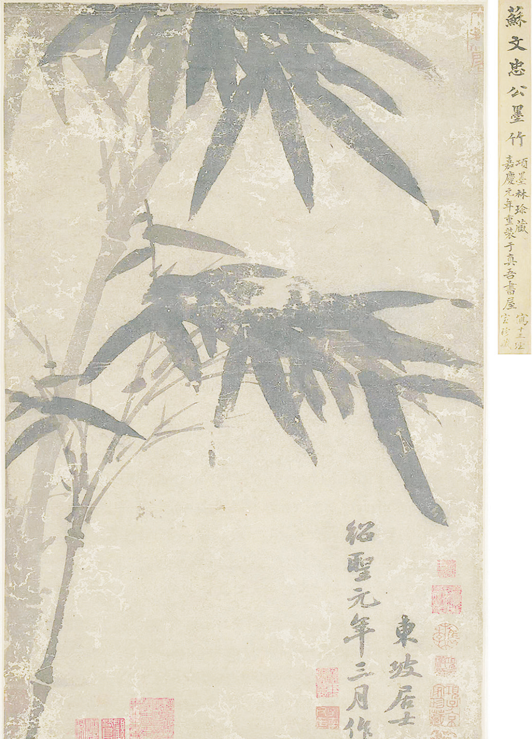
▲蘇軾（傳）《墨竹圖軸》，紐約大都會藝術博物館藏。

第一個收藏《寒食帖》的人，叫張浩，蜀州江源（今四川成都崇州江源）人，河南永安（今河南鞏義）大夫。張浩的收藏事跡，記錄於詩帖的題跋。題跋者系張浩的一個堂孫，南宋文人張續。張浩謁見黃庭堅，求取題跋的時間為元符三年（公元1100年），地點在蜀地眉州青神。黃庭堅是蘇軾的門生。是時，黃庭堅剛剛獲得朝廷的特赦，由戎州（今四川宜賓）到眉州青神，看望姑媽張氏。黃庭堅見到蘇軾詩帖的時候，蘇軾剛好也獲特赦，正輾轉於北歸途中。黃庭堅的草書跋文，清晰可見，歷來被公認為蘇軾寒食詩帖不可或缺의連體知音，逆境中彼此關懷，雖隔千里，一樣演繹著高山流水的千古傳奇。