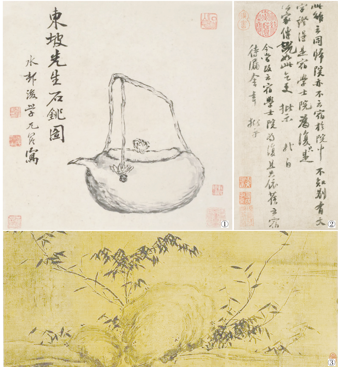
圖1：清·尤蔭《東坡石匏圖》，北京故宮博物院藏。 圖2：蘇軾《歸院帖》，北京故宮博物院藏。 圖3：被譽為中國美術館鎮館之寶之一的蘇軾《瀟湘竹石圖》局部。