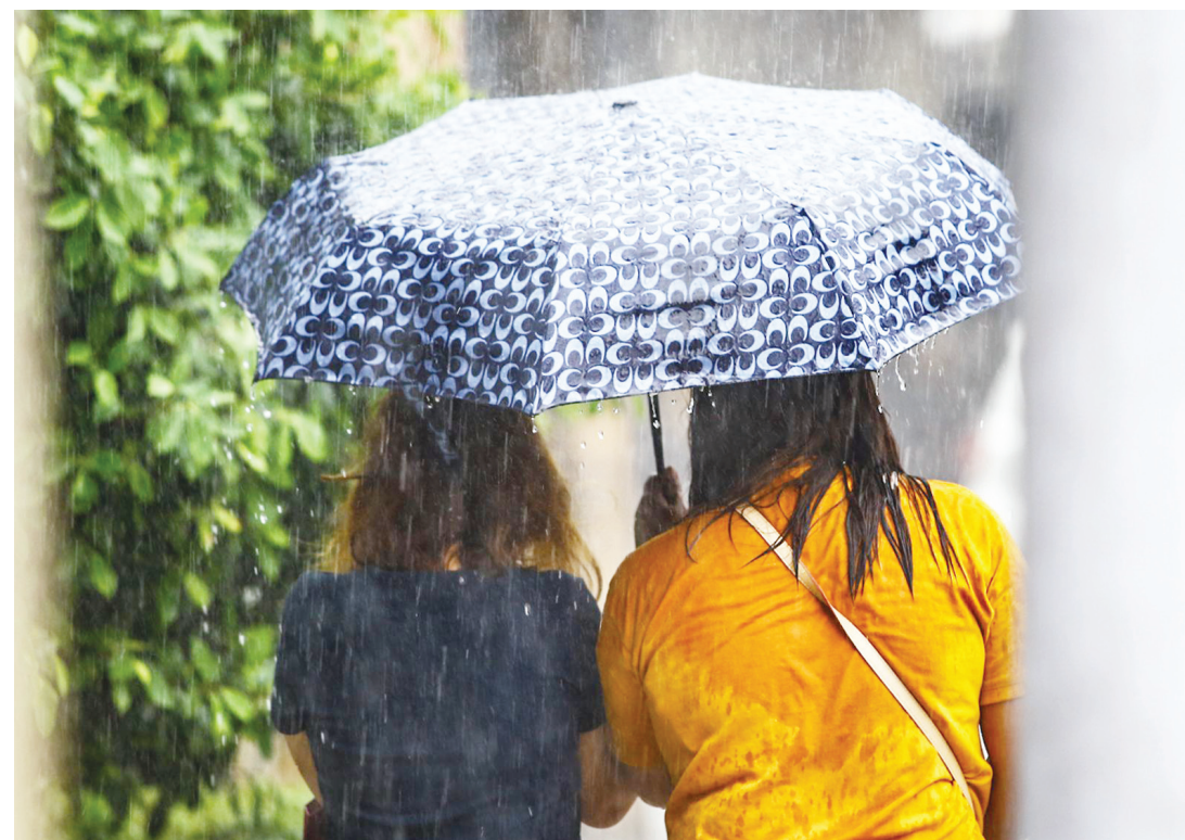
週五下午，在計順市計順大道附近的乙沙路段，降雨雖少，但在酷熱中卻很受歡迎。大岷區本週經歷了短暫的降雨，但高溫指數仍高於 40 攝氏度，處於極端警戒至危險水平。

對外交往無小事，各級部門的對外交往必須遵守嚴格的規範，對於對外交涉的細節，必然會嚴格如實記錄並保留相關證據，包括文本或者錄音，這與菲律賓所說的竊聽完全是兩碼事。