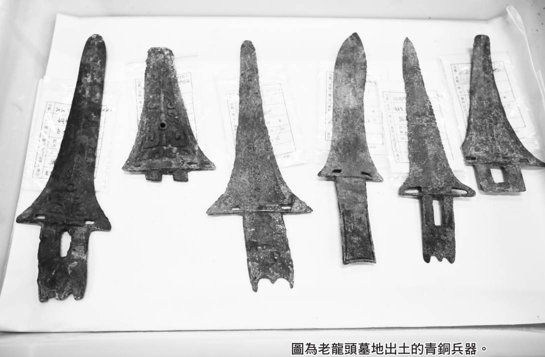
圖為老龍頭墓地出土的青銅兵器。

出土的大量青銅兵器以劍、戈、刀為主，矛較為少見，雙環首劍、盞柄劍、曲頸劍都極具特點。繁縟複雜的青銅馬具，各類裝飾馬元素的青銅器，及大型墓葬殉馬的現象，可見其對馬的喜愛。另外，在一些具有