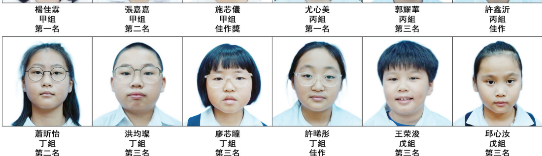
學生現場華文作文比賽