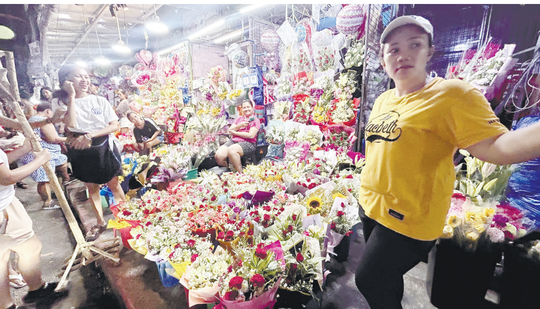
昨日是母親節，但馬尼拉花卉市場生意慘淡，花價一路下滑，花販們怨聲載道。