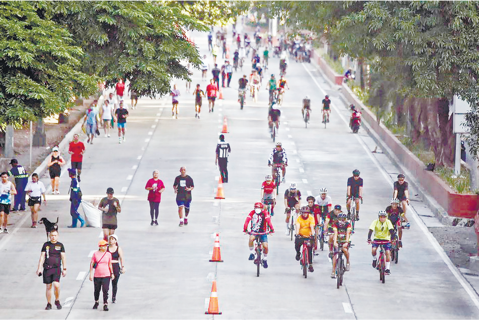
週日，人們沿著羅哈斯大道的一部份步行和騎自行車，馬尼拉市從巴黎武敖斯街到基仁諾大街實施無車週日。無車日將於每週日早上5點至9點實施，以促進該市的環境保護計劃，並鼓勵社區保持健康。