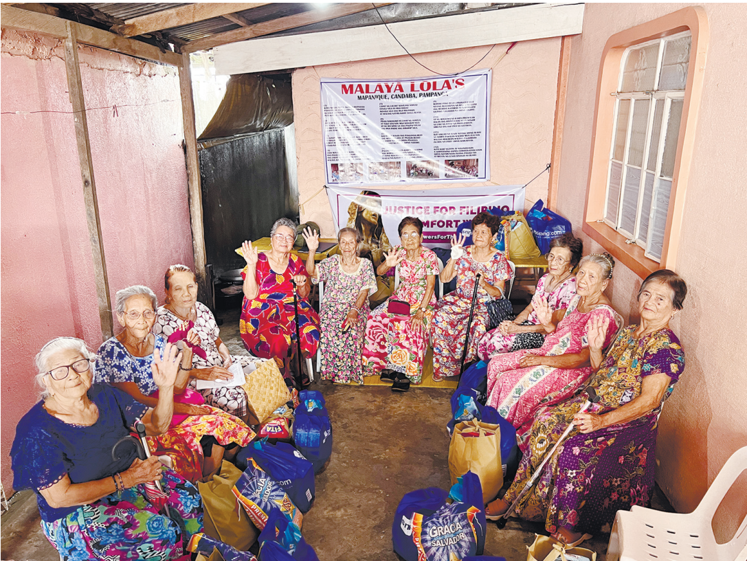
圖為7月6日拍攝的邦邦牙省馬帕尼克村的「自由祖母」組織成員。她們都是二戰時期遭受日軍性侵的菲律賓「慰安婦」。