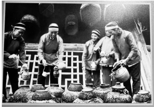
展區珍貴的歷史照片受到關注。