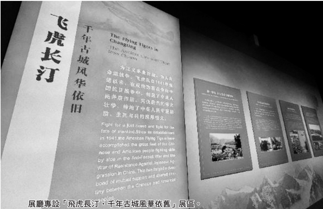
展廳專設「飛虎長汀·千年古城風華依舊」展區。

據說，要交什麼錢，所以待不下去了。這使我感到，你們工作雖很辛苦，但能站穩腳跟，又得較多的待遇，比空手回歸大陸的人好多了。