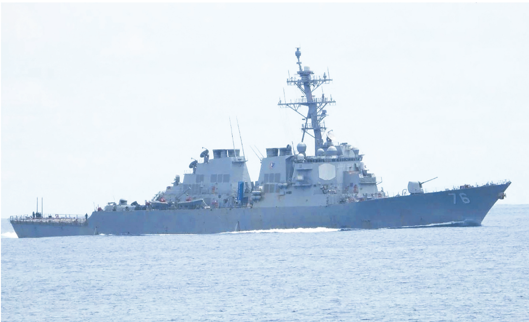
美國海軍驅逐艦希金斯號出現在黃岩島海域。

總統否決此延選法案，指該法案實為2022年遭大法院宣告違憲的第11935號共和國法令的「回收版本」。 馬加仁·查指出，本案與前案存在相同憲政瑕疵。 最高法院2023年指標性判決（案號G.R. No. 263590、G.R. No. 263673）已明示，選舉延遲必須基於「充分重要、實質且迫切」理由，僅以「選舉疲勞」或節省成本等表面因素不足以構成延選正當性。