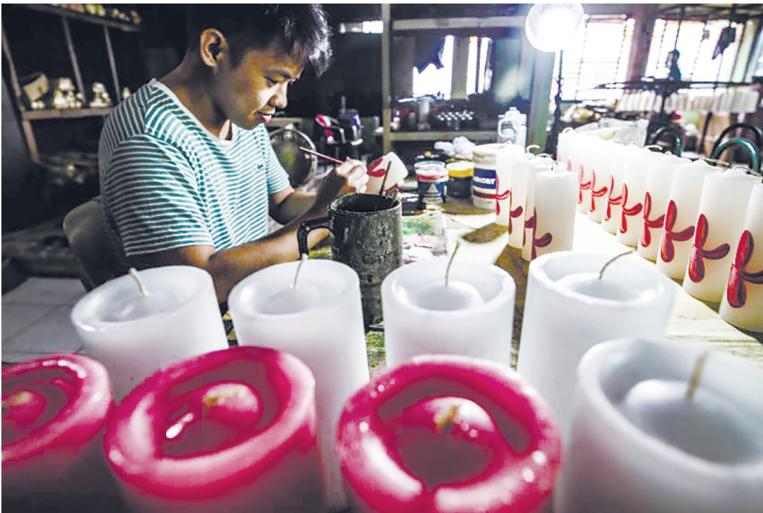
工人於10月31日在加洛干市Domrose蠟燭製造廠繪製花卉圖案。該工廠為每年11月1日亡人節與11月2日萬靈節期間最繁忙的產業之一。

她另一次經歷發生在導覽期間，當她在自由廳區域開玩笑稱要與廚師同事們試坐歷任總統的座椅時，室內一名魁梧男子突然怒氣沖沖地向她逼近。