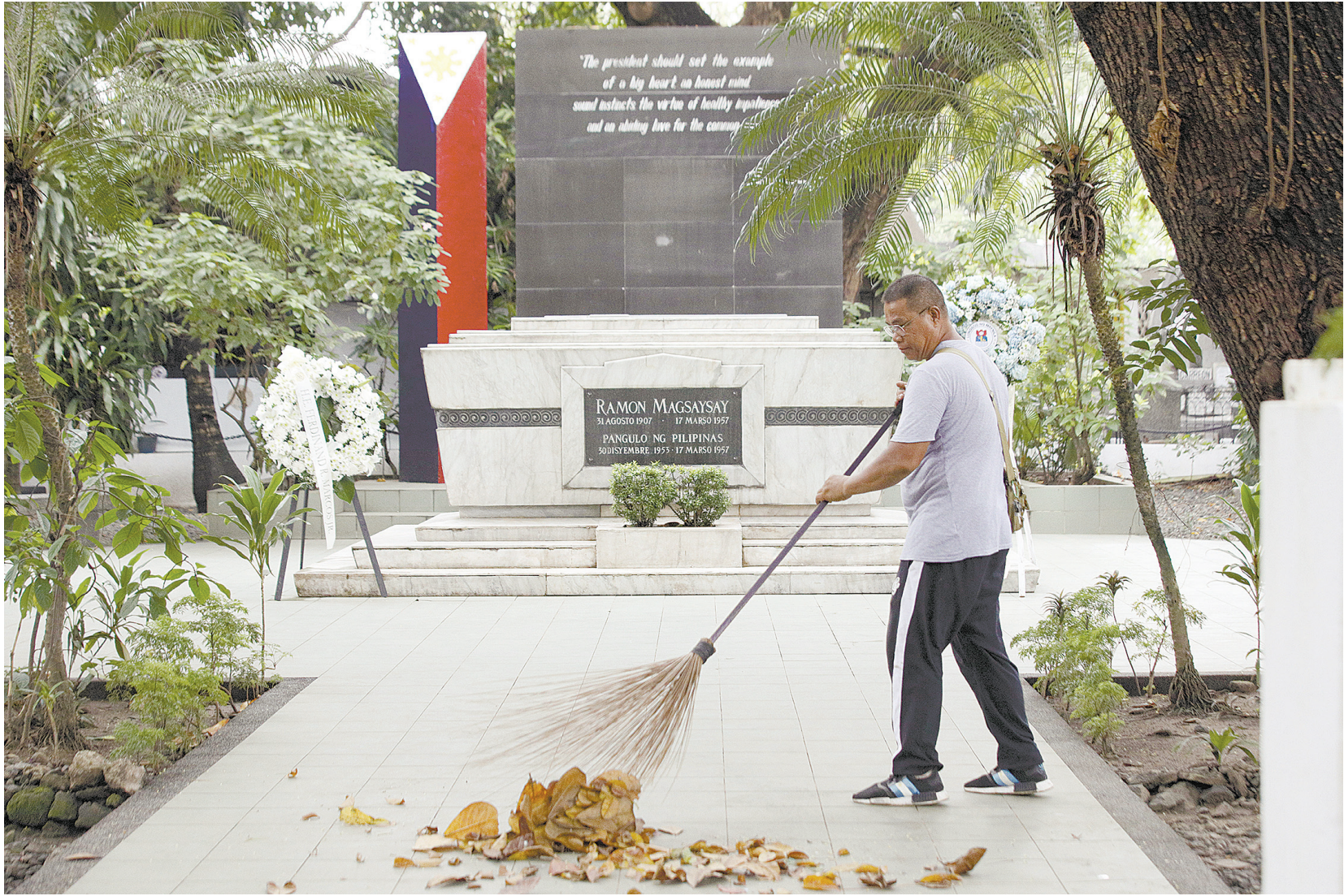
一名管理員於10月31日在馬尼拉北區公墓維護已故總統南文·麥獅獅的陵墓。麥獅獅為菲律賓第七任總統，任期自1953年持續至1957年3月17日其於宿務空難逝世前。