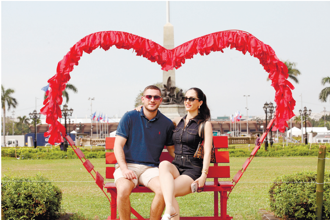
遊客於2月13日在馬尼拉黎剎公園的「公園之心」裝置藝術前合影留念。夜幕降臨時，公園將亮起燈光，成為情人節前夕聚會之絕佳地點。

電話：82565536；0917-8802688 0917-1876868 0917-3095688