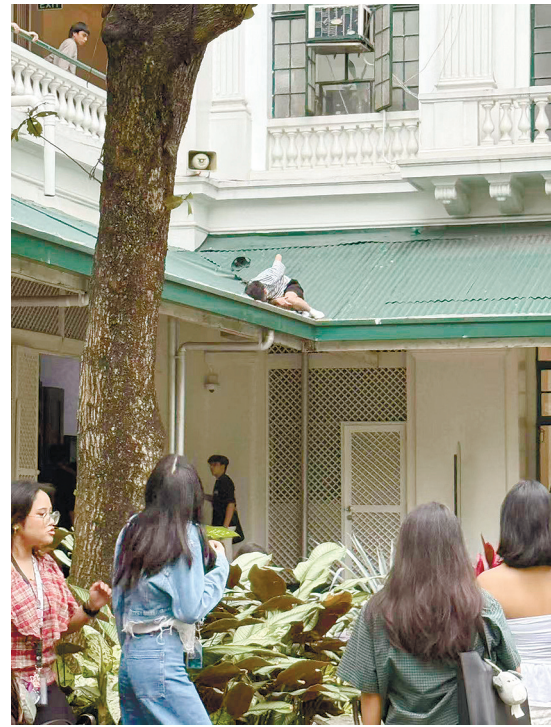
馬尼拉拉剎大學證實，2月13日校園內發生一起學生從建築物一層樓高處墜落之意外事件。

蘇道週四透過 Viber 信息告訴記者：「當有人故意激怒你，你若不反應，只會更令人惱火！我寧願選擇令人惱火！」