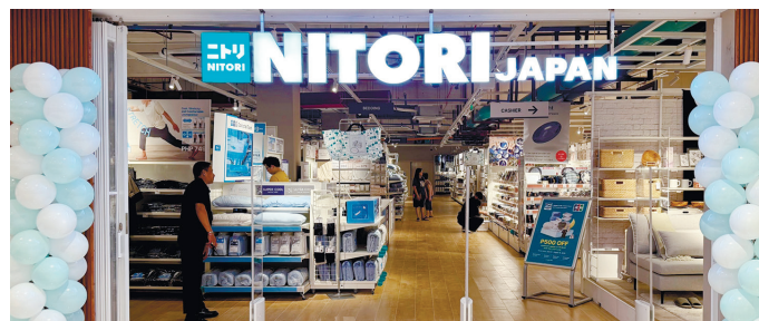
宜得利（Nitori）其招牌的日式品質與價格實惠的時尚設計，持續重新定義家居生活。