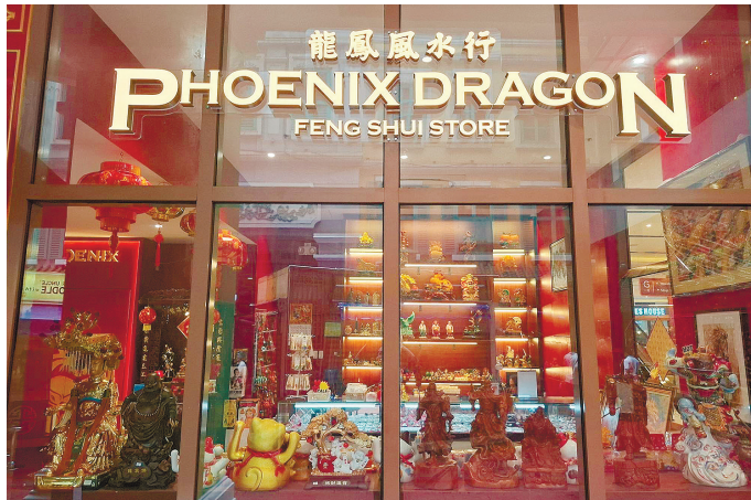
龍鳳風水行（Phoenix Dragon）提供精心挑選的吉祥飾品及定制護身符，確保每位賓客的故事都能體現在他們所選的紀念品中。