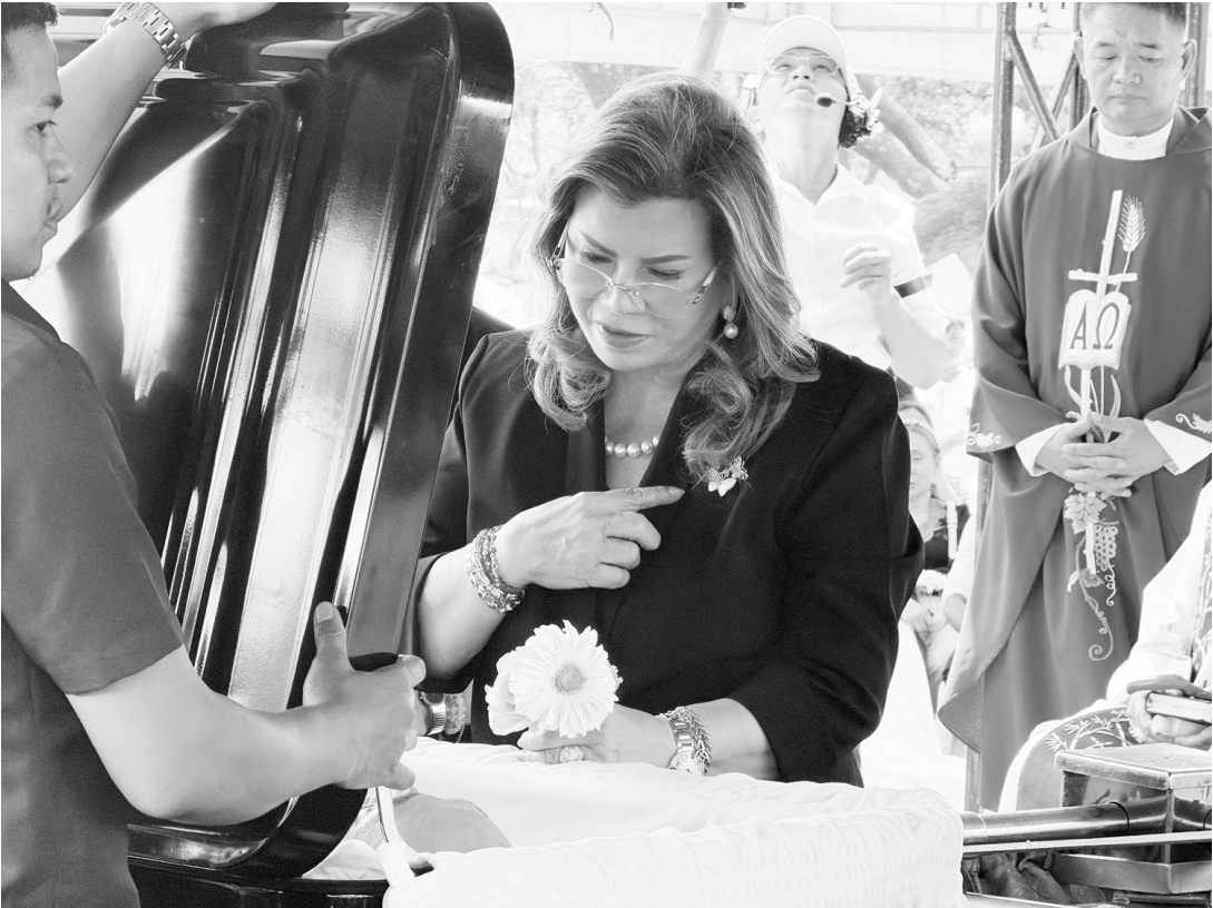
前眾議長黎敏尼舍昨日在英雄墓園入土為安。黎敏尼舍為二戰後任期最長之眾議長，獲完整軍禮安葬之榮譽。

國家測繪暨資訊局是在參議員馬科禮查（Rodante Marcoleta）聲稱該局尚未向聯合國秘書長辦公室遞交更新版菲律賓濱地圖作為海洋主權主張正式通知後，發表上述聲明。 馬科禮查曾表示，儘管前總統蕊蕊·亞謹諾已在2012年發布行政命令，卻仍未辦理此事。 關於海洋疆界，國家測繪暨資訊局表示，我國專屬經濟區自群島基線向外延伸至200海里。 該局指出，這形成連續的弧形疆界，而非直線構成的多邊形。 國家測繪暨資訊局表示，專屬經濟區是依據第9522號共和國法令所定基線之精確地理空間資料繪製，讓導航系統與製圖軟體得以精確判定海洋範圍。