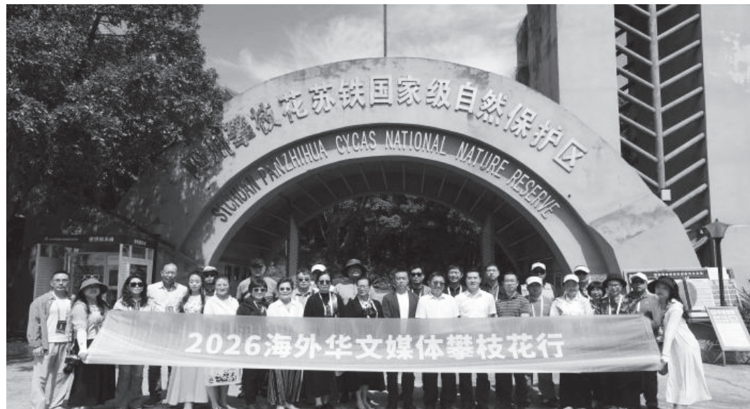
▲9日，海外華文媒體代表在四川攀枝花蘇鐵國家級自然保護區門前合影。

「天—空—地—人」立體監測體系，通過無人機航拍三維建模實現全域管轄，還與科研機構合作，用DNA技術精準鑒定蘇鐵性別，發現野生種群雌雄比趨近1比1，正健康擴張。更值得一提的是，科研團隊從攀枝花蘇鐵中提取毒性蛋白基因，培育出殺蟲效率更高的抗蟲棉並投產，讓「活化石」實現價值轉化。