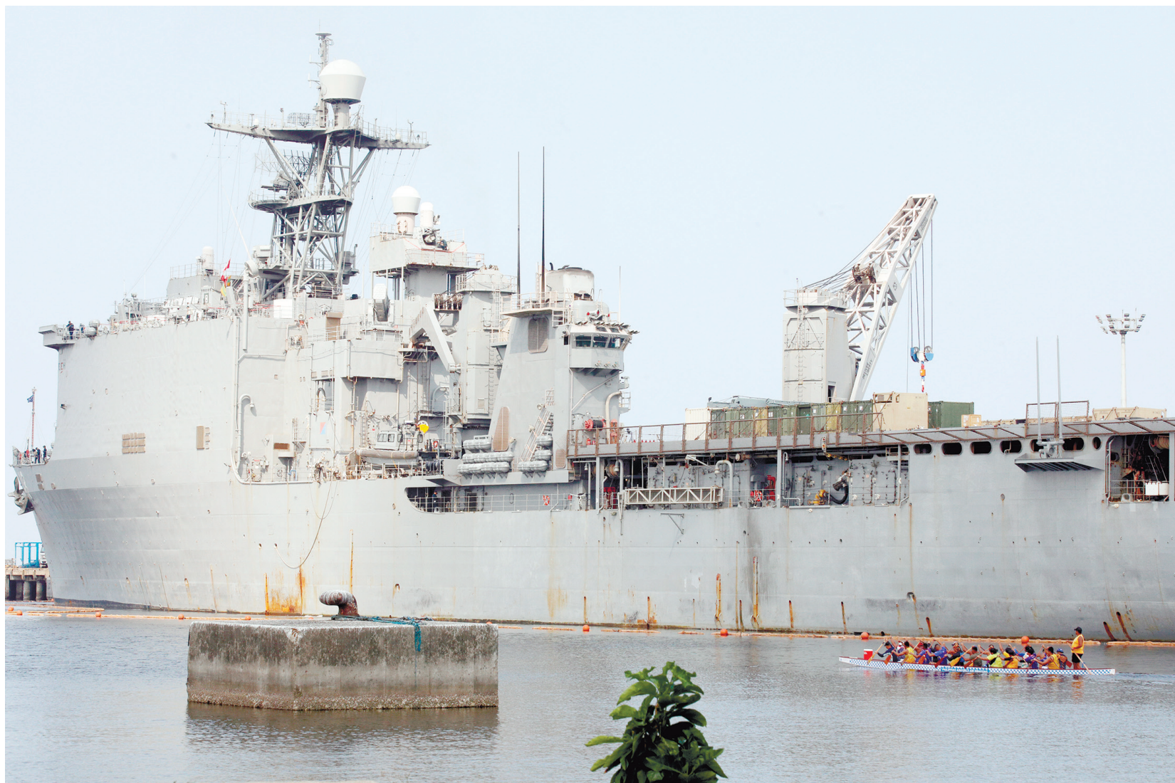
美國海軍「阿什蘭號」於週五停靠在馬尼拉南港的15號碼頭。該艦目前部署於印太地區，最近在宿務南港進行了模擬戰時維修作業。

本報訊：美國軍閥網站報道，五角大廈計劃於2028年之前，在菲律賓南部新建一處燃料儲存設施。菲律賓軍方昨日對此表示歡迎，認為這項設施將有助於提升菲方在南海嚇阻力。