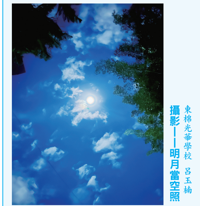
東棉光華學校 呂玉楠 攝影——明月當空照