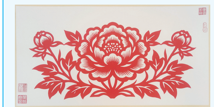
剪紙——一枝獨秀 僑中學院總校 鑒康利