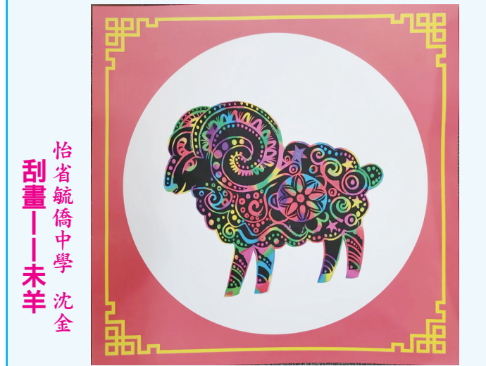
怡省毓僑中學 沈金 刮畫——未羊