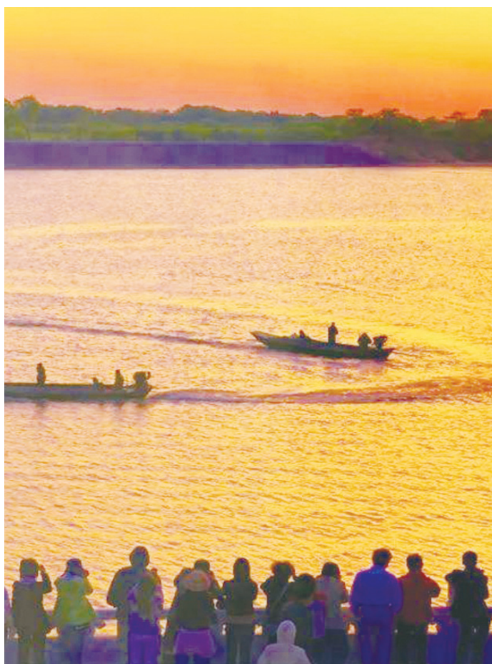
▲從左到右依次為：赫哲族烏日貢大會；黑瞎子島上憨態可掬的黑熊；黑瞎子島看日出。