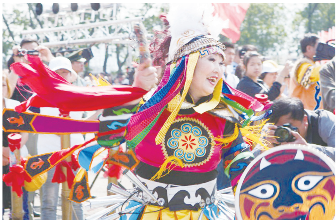
▲赫哲族烏日貢大會。

星火朝鮮族鄉，探訪新中國第一集體農莊，體驗朝鮮族打糕製作、辣白菜醃製過程，身著朝鮮族傳統服飾漫步稻田，感受田園民俗風情。