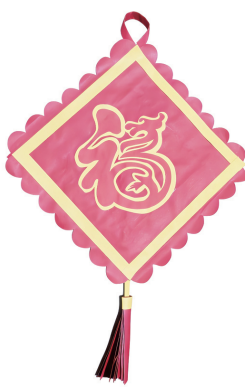
剪紙——萬里傳福 （指導教師：劉雨晴） 密三密斯光華中學 許家寧