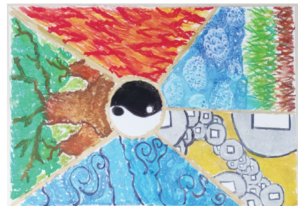
繪畫——菲中攜手，共繪世界和平藍圖 北黎刺育仁中學 李一莎 （指導教師：邢中蘭）