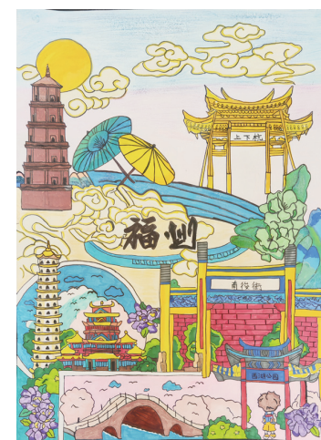
繪畫——榕城印象 僑中學院總校 吳景景 （指導教師：鑿康利）