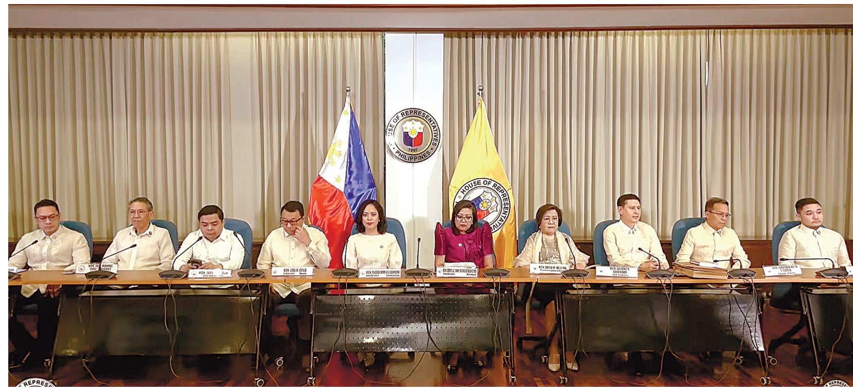
眾議院檢察小組於5月19日在副總統莎拉·杜特地彈劾審判前夕舉行記者會。