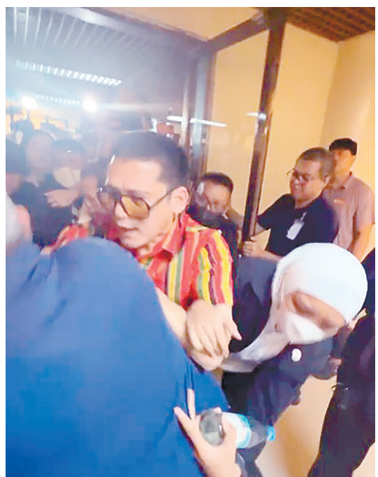
6月4日，參議員羅賓·巴迪惹與內政部長黎慕惹發生衝突，此前黎慕惹據稱阻止參議員皮姬·加耶丹諾進入會議廳。

混亂、有一定隨意性。」代帆說。 例如，據中國駐菲使館此前消息，5月28日晚，64名被菲方羈押的中國公民獲釋，中使館派員赴現場照料。還有6人正在辦理獲釋手續。他們此前在東米薩米斯省一鋼鐵廠工作，5月15日遭菲軍法部門查扣羈押。菲司法部日前作出裁定：對涉事中國公民涉嫌違反菲核能安全法、移民法、勞工法等指控證據不足，應予釋放。 中國駐菲使館還提到，於5月18日派員赴菲國調局看守所對69名中國工人進行領事探視，敦促菲方盡快依法公正妥善處理有關案件，切實保障中國公民安全和合法權益。上述中國公民近日在菲軍警對東米薩米斯省一家鋼鐵廠的突擊行動中被查扣。 代帆表示，這次抓捕中國工人，菲方以軍警出面，這比較不符合常理。一般來說，這樣的執法案子在菲要麼是移民局，要麼是國家調查局出面。據此推測，菲軍方在本次突擊抓捕中國工人行動中可能有特別的利益或考量。 不過，代帆指出，在菲中國公民的群體比較龐大，其中確有部分人在菲從事的職業與簽證類型不一致。例如，有些中國人拿著投資簽證、退休簽證，卻在菲從事零售業，這是不被允許的。菲對外國人在菲從事零售業設立了很高的門檻。另外，有一些中國勞工赴菲工作，由於菲辦理當地工作簽證比較耗時，部分人就會提前開始工作，這也存在法律風險。 「這些不算太大的問題過去一二十年間持續存在，但並未對菲中關係構成很大影響。」代帆說，「比如說以前，菲政府偶爾也會抓一抓在菲非法從事零售業的中國人，但一般都是聖誕節之前去抓。他們也是想通過這樣的方式撈一點錢。」 根據菲方通報，一名涉離岸博彩（POGO）被羈押的中國公民5月28日在菲移民局監獄突然離世，原因待查。 該事件發生後，中國駐菲使館即向菲方提出嚴正交涉，要求對中國公民死亡情況展開全面調查，如存在管理責任或過失，應嚴肅追究處理。同時，聯繫死者家屬，協助處理善後事宜。代帆對此表示，菲監獄的腐敗程度以及環境惡化是眾所周知的，不排除有人為因素導致了上述中國公民的非正常死亡。菲方必須給中方一個合理的調查結果。 他續指，隨著菲取締網絡博彩業，目前仍滯留在菲且繼續從事網絡博彩的中國公民，無疑屬於非法就業，但是他們的基本權利包括人身權利必須得到尊重和保障。與此同時，中國法律禁止任何形式的賭博活動，包括網絡博彩、中國公民出境賭博、在境外開設賭場並招攬中國公民參賭等行為都是違法的。據中國駐菲使館5月16日消息，近日，中菲兩國執法部門合作抓獲遣返涉嫌組織跨境賭博犯罪的陳某某。陳夥同他人在境外搭建非法賭博網站，向數千名內地群眾招攬吸賭，惡意設置取現門檻賺取暴利，涉案金額逾2億元人民幣。