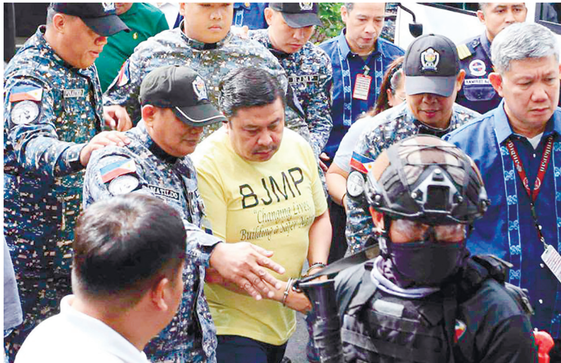
6月4日，參議員晶貴·伊斯查拉抵達計順市的廉政法庭，出席與防洪工程弊案有關的貪污和掠奪罪指控的提審。然而，他掠奪罪案件的提審被重新安排在6月30日。

民提供的實際支持，但趙多洛不僅沒有表達感謝，反而將其形容為「糖衣包裝」及「別有用心」，猶如現實版《農夫與蛇》的故事。 季凌鵬進一步批評，趙多洛的言論再次顯示其漠視菲律賓人民福祉，缺乏基本感恩之心，只關注個人政治利益，甚至不惜將人民生計問題作為政治操作工具。 他表示，這種做法嚴重損害中菲關係及雙方互信，完全違背菲律賓國家利益及人民利益。 季凌鵬指出，自今年以來，在中菲雙方共同努力下，兩國關係已出現來之不易的改善跡象。雙方透過外交接觸和溝通，逐步推動關係回到穩定發展軌道。 然而，他認為有少數人士對此並不樂見，因而不斷製造事端、挑起對立，企圖破壞雙邊關係改善成果。 他表示，菲律賓政府曾多次表示希望妥善處理與中國之間的分歧，推動雙邊關係穩定發展。中方希望菲方能夠言行一致，不要讓個別人士反覆破壞維持兩國關係穩定的努力。 季凌鵬最後強調，中方願繼續與菲方透過對話和協商管控分歧，推動中菲關係健康穩定發展，共同維護地區和平與穩定，造福兩國人民。