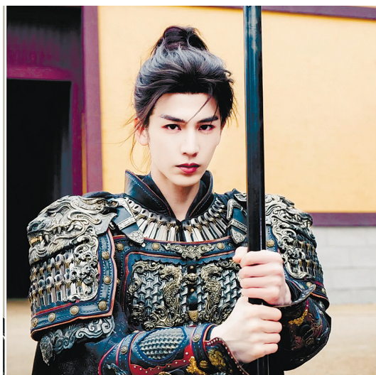
張穎菲是微短劇《真千金她是學霸》的主角，在菲律賓以其角色名「琳達·沃克」

謝征，而田曦薇則飾演性格潑辣堅韌的市井屠戶女樊長玉。即使該劇在播完數月後，仍在全球持續引起關注。 除了《逐玉》，張凌赫還參演多部作品，包括《心動的瞬間》（2020年）、《完美的他》（2021年）、《我和我的時光少年》（2021年）、《蒼蘭訣》（2021年）、《雲之羽》（2023年）、《度華年》（2024年）、《愛你》（2025年）、《櫻桃琥珀》（2025年）等。他在社交媒體上也擁有大量粉絲，Instagram粉絲數達510萬，微博粉絲數更已將近2000萬。張凌赫還有兩部備受期待的主要劇集即將推出：與王楚然合作的民國愛情劇《歸鸞》，以及與林允合作的古裝愛情劇《歸鸞》。兩部作品預計將分別在愛奇藝和騰訊視頻平台播出。 張穎菲將來訪 井泉大使也確認中國女演員張穎菲將於6月7日抵達菲律賓。