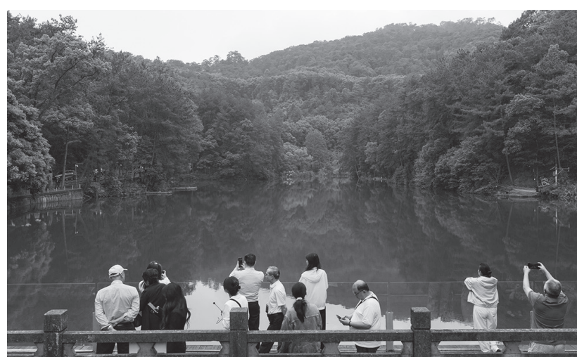
海外華媒僑領走進黛湖，了解北碚區堅守生態優先的生動實踐。

走在黛湖岸邊，現場工作人員介紹，2022年夏天，縉雲山遭遇特大山火，山林植被、生態體系遭受重創，給區域自然生態帶來嚴峻考驗。山火過後，北碚啟動縉雲山全