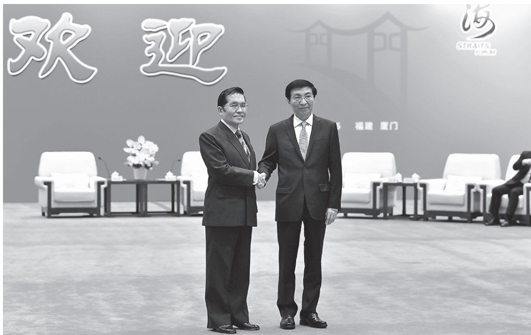
6月13日，第十八屆海峽論壇大會在廈門舉行。中共中央政治局常委、全國政協主席王滬寧（右）出席並致辭。大會開始前，王滬寧會見張榮恭等參加論壇的台灣嘉賓代表。

過去幾年，張榮恭曾多次赴大陸參訪交流。他指出，近期兩岸互動出現積極態勢。今年2月，國共兩黨時隔十年後恢復舉辦智庫論壇，達成15項共同意見。4月，中共中