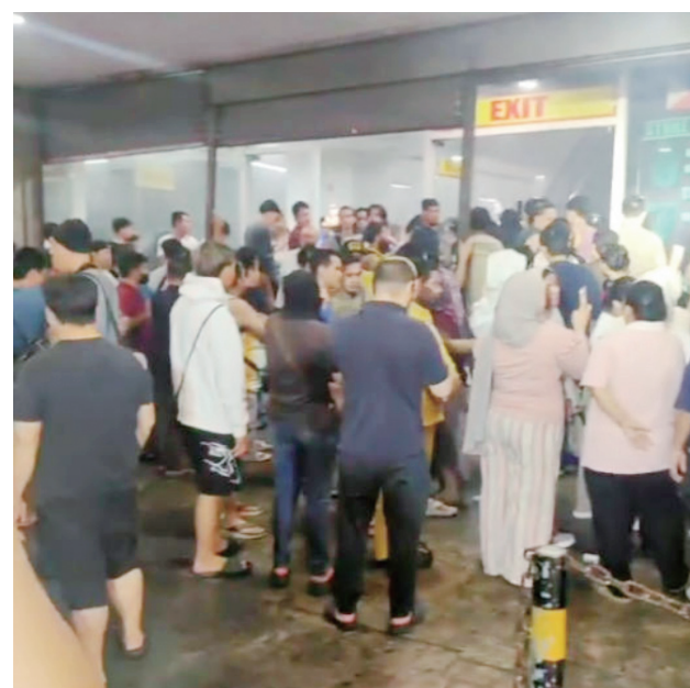
左圖為999商場外擠滿人群。右圖為菲華志願消防員在商場內部。