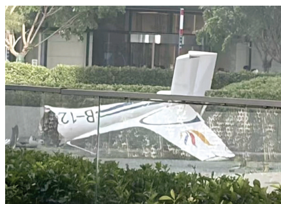
一架小型飛機於週五(26日)傍晚撞向中國北京市朝陽區的中信大廈，機身斷裂墜毀。 <網路圖片>