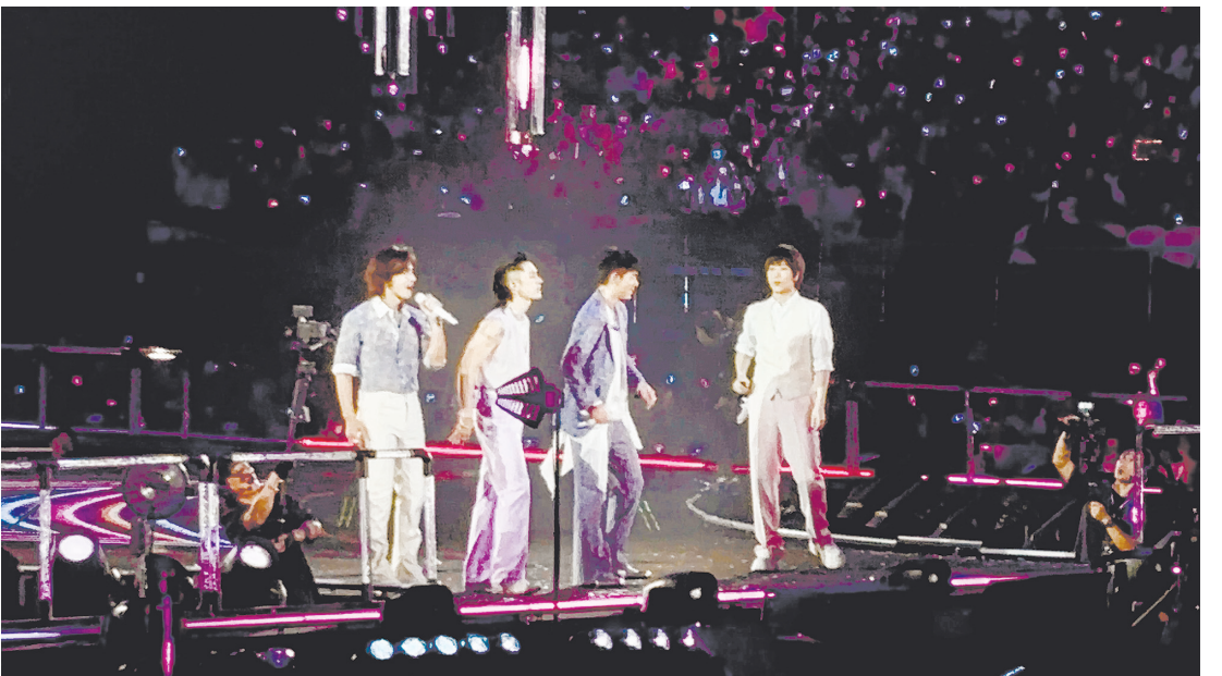
台灣男團F4的言承旭、吳建豪、周渝民及五月天阿信，在6月27日於武六千省菲律賓體育場舉行的「F4 FOREVER」首次世界巡迴演唱會中，為菲律賓歌迷獻唱。F4於2000年代初期，在台灣熱門戲劇《流星花園》播出期間，於菲律賓獲得高人氣。