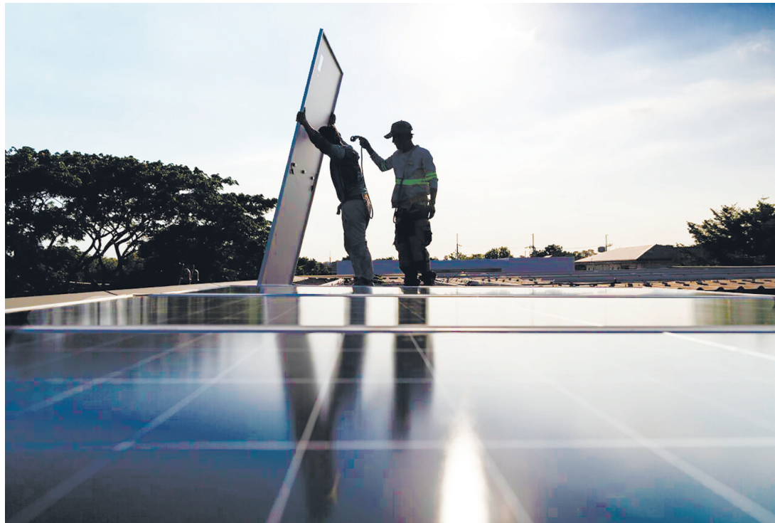
菲律賓民眾近來為了減輕飆漲電費的負擔，正蜂擁安裝屋頂太陽能板。

表示，27日至28日，南部戰區組織海空力量位南海海域進行例行巡航。菲律賓拉攏域外國家組織所謂「聯合巡航」，攪局南海，破壞地區和平穩定。南部戰區部隊將堅決捍衛國家領土主權和海洋權益，堅定維護地區和平穩定。 另據菲方消息，菲律賓與美國27日至28日完成今年第五場代號「海事合作活動」(MCA)的南海聯合巡航，與上一次相隔僅8天。公開信息顯示，菲律賓2023年11月開始與美國舉行MCA聯合巡航。2024年4月更擴大為「多邊海事合作活動」(MMCA)巡航，有日本、加拿大、澳大利亞等國家參與。