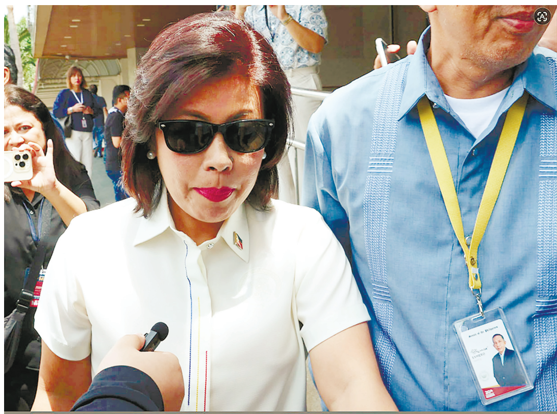
副總統辦公室幕僚長萊卡·洛佩茲律師，於7月9日前往參議院。洛佩茲未說明其訪問原因。她預定於7月14日(週二)出席參議院彈劾法庭。